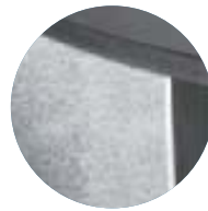
coloris | Farbe pierre ollaire _ Speckstein