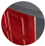
coloris | Farbe céramique bordeaux Keramikbausatz bordeaux