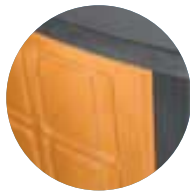
coloris | Farbe céramique Terra di Siena Keramikbausatz Terra di Siena