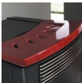
BORDEAUX (AVEC CRAQUELURES) BORDEAUX (MIT HAARRISSEN)