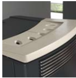
POIVRE-ET-SEL SALZ UND PFEFFER