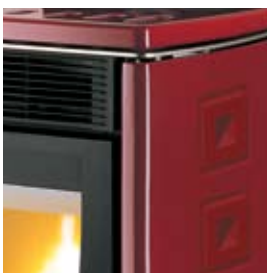
BORDEAUX (AVEC CRAQUELURES) BORDEAUX (MIT HAARRISSEN)