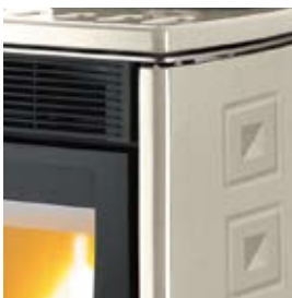
POIVRE-ET-SEL SALZ UND PFEFFER