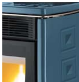
BLEU MARINE MEERBLAU