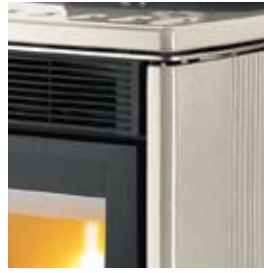
POIVRE-ET-SEL SALZ UND PFEFFER