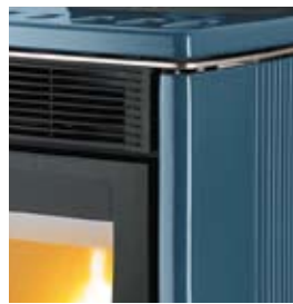
BLEU MARINE MEERBLAU