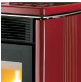
ROUGE BORDEAUX (avec craquelures) BORDEAUXROT (MIT HAARRISSEN)