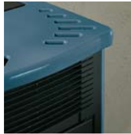
BLEU MARINE MEERBLAU