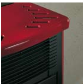
ROUGE BORDEAUX (avec craquelures) BORDEAUXROT (mit Haarrissen)