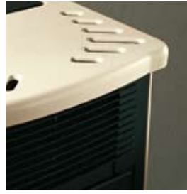
BLANC AVEC FIL BORDEAUX WEISS MIT BORDEAUX-FARBENEM STREIFEN