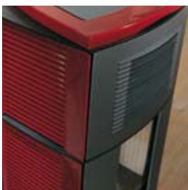
ROUGE BORDEAUX (avec craquelures) BORDEAUXROT (mit Haarrissen)