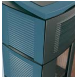
BLEU MARINE MEERBLAU