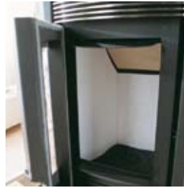
FOYER EN ALUTEC® FEUERRAUM AUS ALUTEC®

*** Le poids varie selon l'habillage. Das Gewicht variiert je nach Verkleidung.