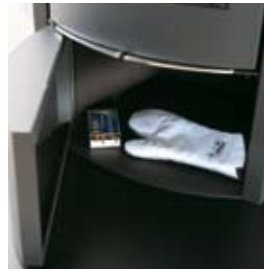
COMPARTIMENT PORTE- USTENSILES STAURAU FÜR ZUBEHÖR