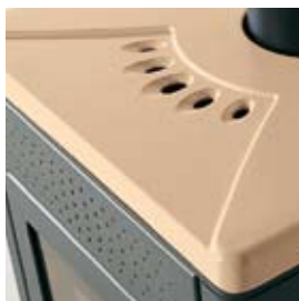
CÉRAMIQUE SABLE SANDFARBENE KERAMIK

AUSSER DEN ABGEBILDETEN VERKLEIDUNGEN SIND AUCH FOLGENDE AUSFÜHRUNGEN ERHÄLTICH: