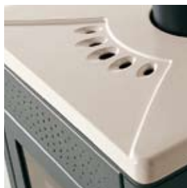
CÉRAMIQUE BLANC- CRÈME SAHNEWEISSE KERAMIK