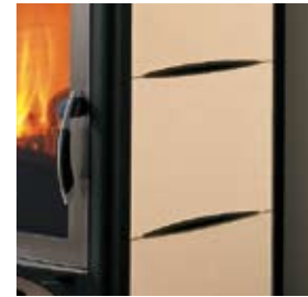
CÉRAMIQUE SABLE SANDFARBENE KERAMIK

EN PIERRE SERPENTINE OU EN PIERRE OLLAIRE | AUS SERPENTIN ODER SPECKSTEIN