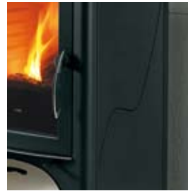
ACIER PEINT EN NOIR STAHL SCHWARZ LACKIERT