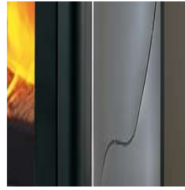
ACIER INOX DESIGN DESIGNERREDELSTAHL

AUSSER DEN ABGEBILDETEN VERKLEIDUNGEN SIND AUCH FOLGENDE AUSFÜHRUNGEN ERHÄLTICH: