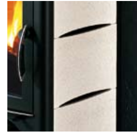
CÉRAMIQUE POIVRE-ET-SEL KERAMIK SALZ UND PFEFFER