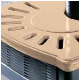
CÉRAMIQUE SABLE SANDFARBENE KERAMIK