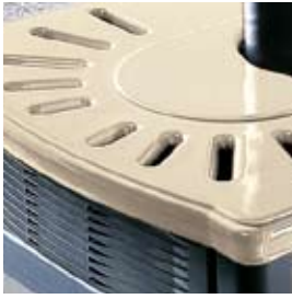
CÉRAMIQUE BLANC-CRÈME SAHNEWEISSE KERAMIK

AUSSER DEN ABGEBILDETEN VERKLEIDUNGEN SIND AUCH FOLGENDE AUSFÜHRUNGEN ERHÄLTICH: