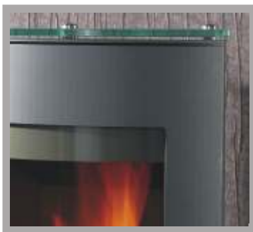
Sonderzubehör: Glasabdeckplatte und Holzschublade