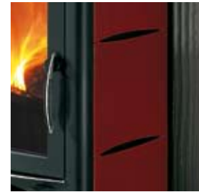
CÉRAMIQUE ROUGE BORDEAUX BORDEAUXFARBENE KERAMIK (MIT HAARRISSEN)