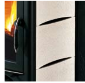
CÉRAMIQUE POIVRE-ET-SEL KERAMIK SALZ UND PFEFFER