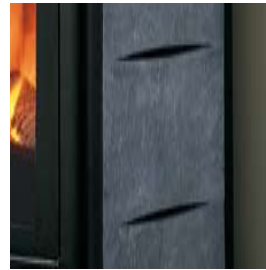
PIERRE SERPENTINE OUIPIERRE OLLAIRE AUS SERPENTIN ODER SPECKSTEIN