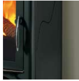
ACIER PEINT EN NOIR STAHL SCHWARZ LACKIERT

AUSSER DEN ABGEBILDETEN VERKLEIDUNGEN SIND AUCH FOLGENDE AUSFÜHRUNGEN ERHÄLTICH: